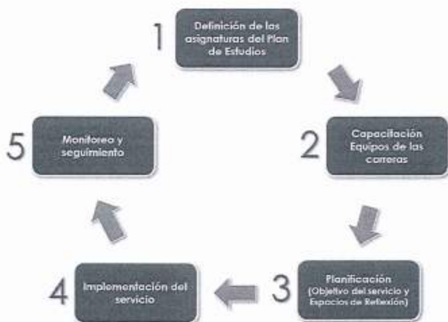
Figura 2: Implementación en la asignatura

En las Etapas 3, 4 y 5 participará la Vicerrectoría de Vinculación con el Medio, para apoyar, formalizar y certificar aquellas acciones propias de su área, en coordinación con la Dirección de Docencia de Pregrado, con el propósito de potenciar los aprendizajes de los estudiantes en contexto real.