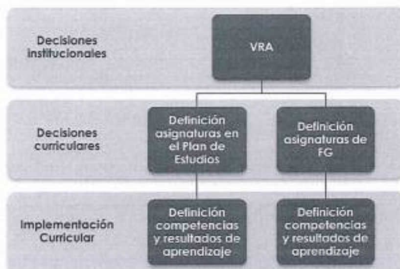
Figura 1: Proceso de Implementación de A+S

La instalación de la Política sigue el siguiente proceso: