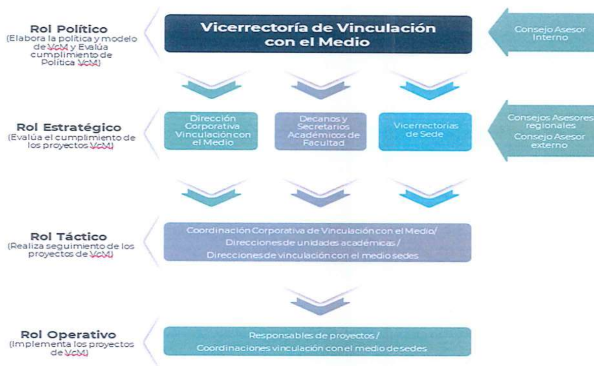
FIGURA N° 3: GESTIÓN DE LA FUNCIÓN DE LA VINCULACIÓN CON EL MEDIO, ROLES DEL NIVEL CENTRAL Y UNIDADES ACADÉMICAS

Luego, en la Figura N°3 se muestran gráficamente los roles definidos desde el nivel central o corporativo hasta las unidades académicas ejecutoras, de los proyectos e iniciativas para la gestión de la función de la VcM en la institución. La toma de decisiones y los procesos ejecutados en cada uno de estos roles contemplan desde lo político – estratégico, hasta lo táctico – operativo.